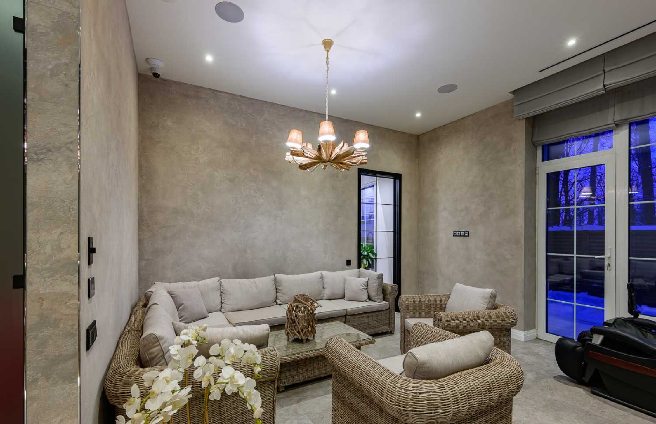
Рублёво-Успенское шоссе, 15 км., посёлок Пекин