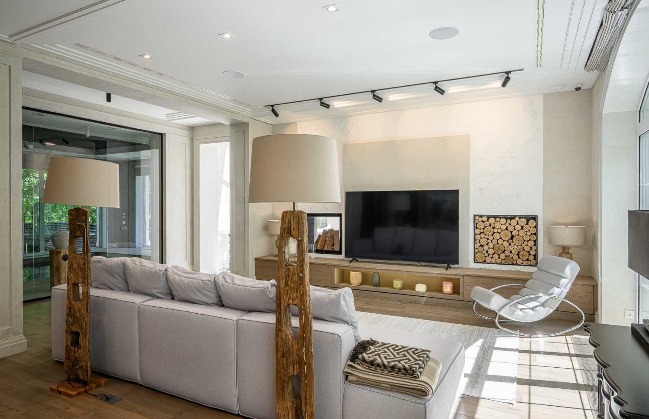
Рублёво-Успенское шоссе, 15 км., посёлок Пекин