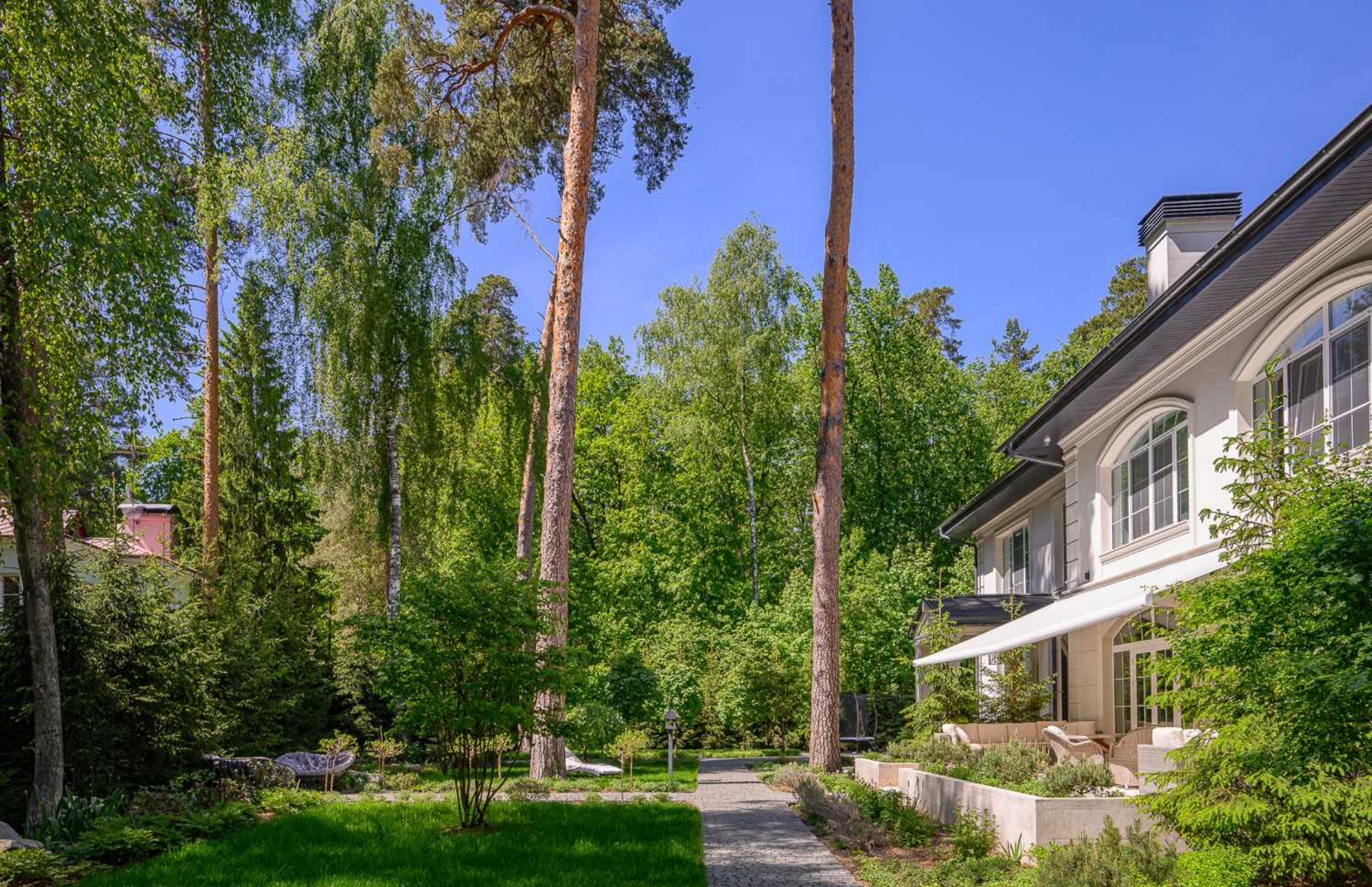
Рублёво-Успенское шоссе, 15 км., посёлок Пекин