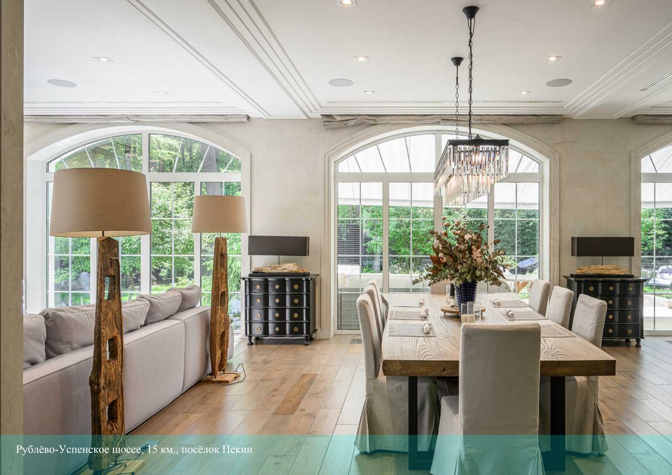
Рублёво-Успенское шоссе, 15 км., посёлок Пекин