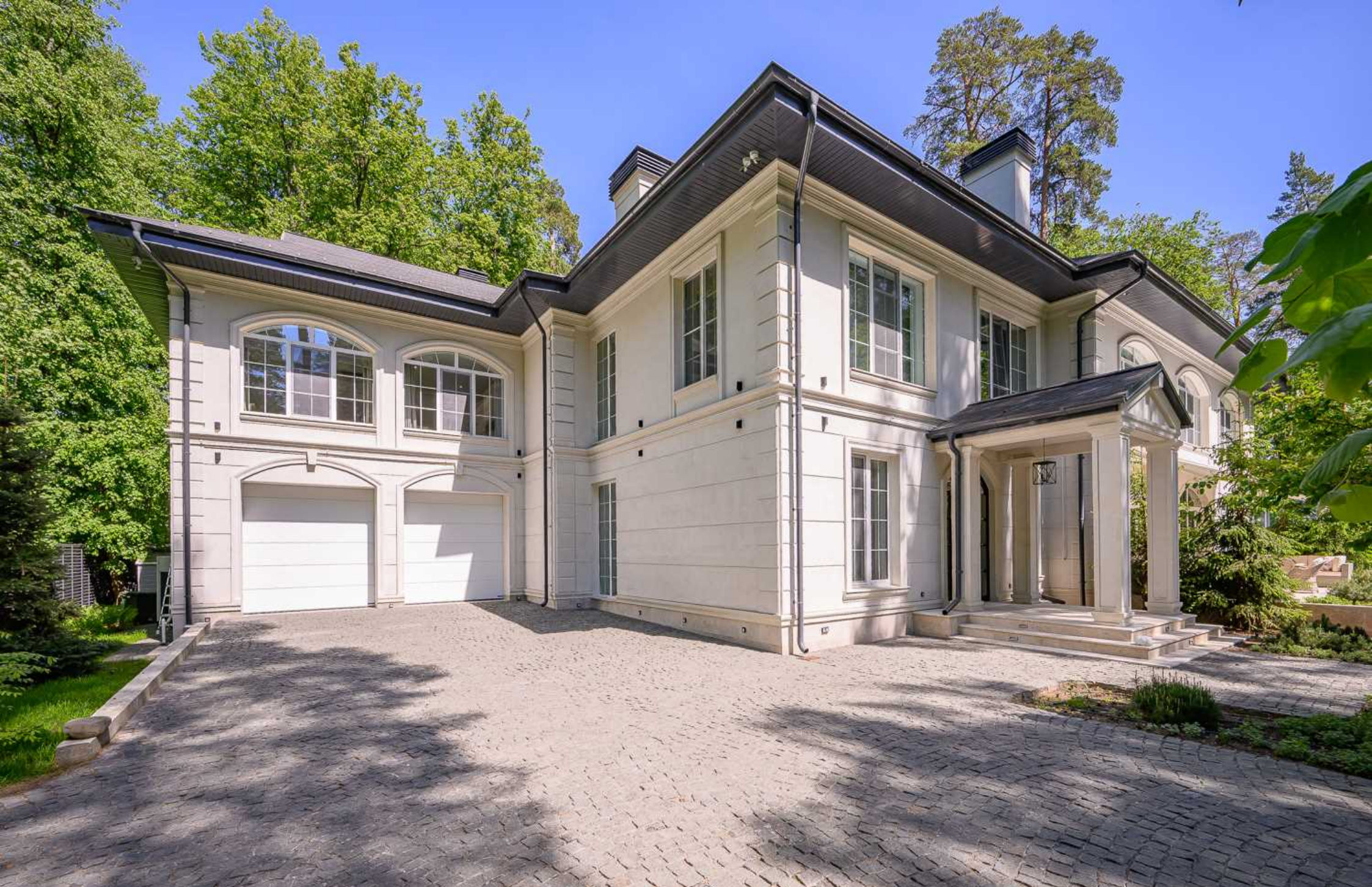
Рублёво-Успенское шоссе, 15 км., посёлок Пекин