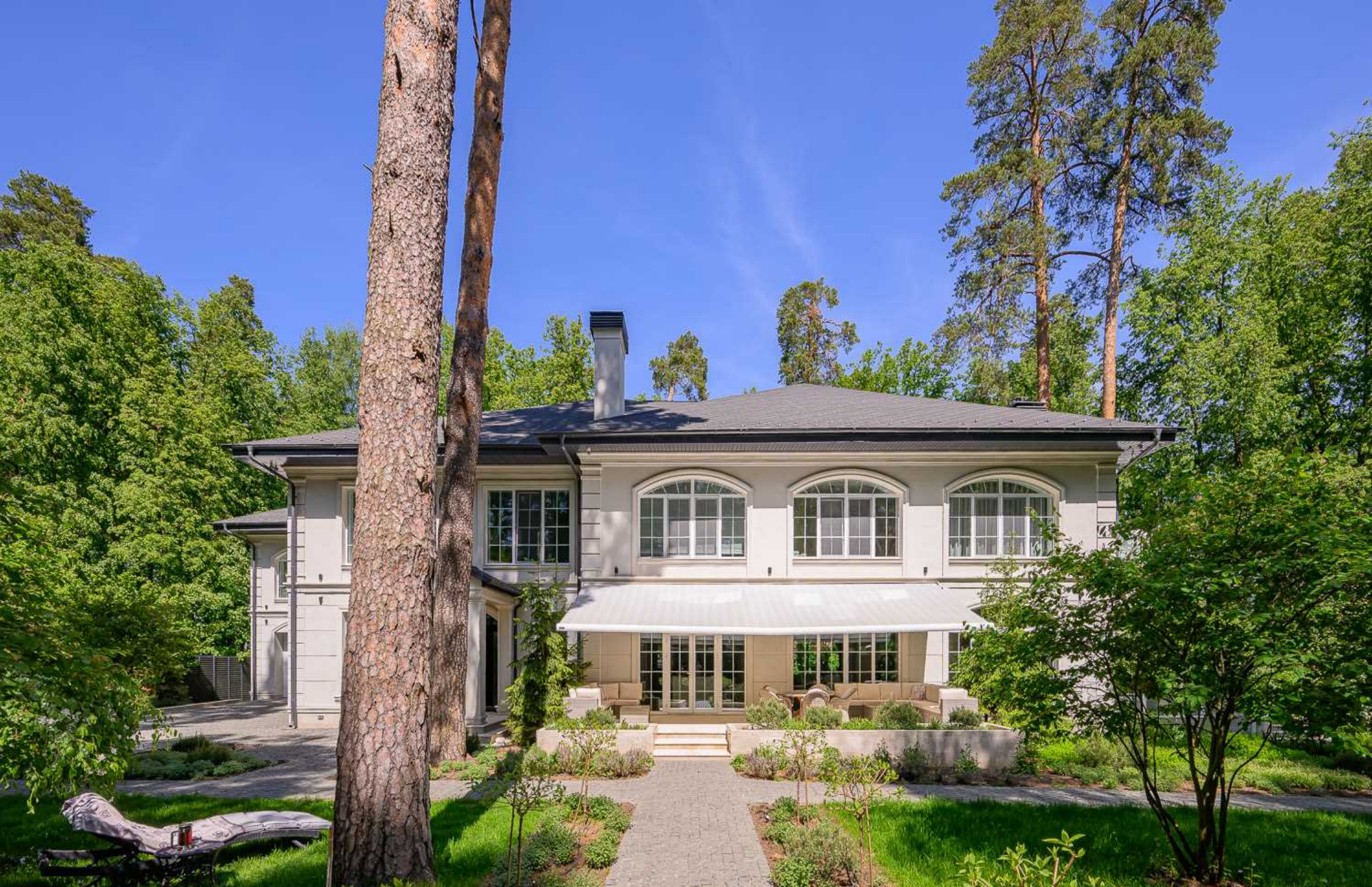
Рублёво-Успенское шоссе, 15 км., посёлок Пекин