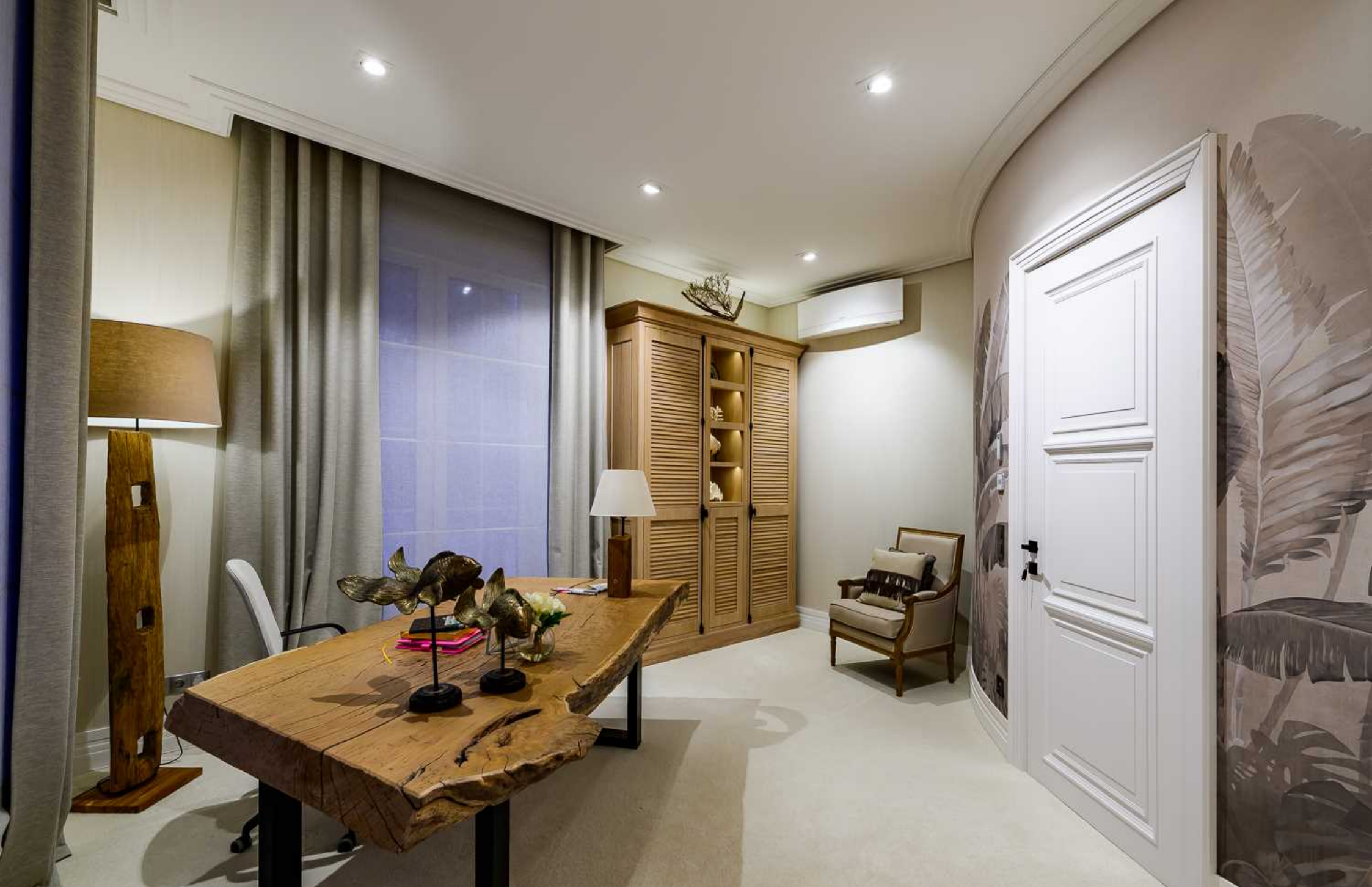
Рублёво-Успенское шоссе, 15 км., посёлок Пекин