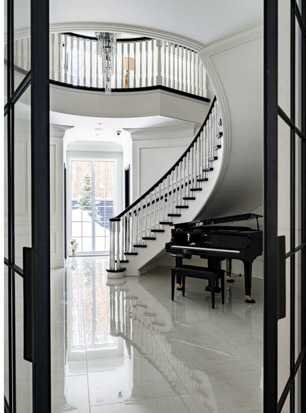
Рублёво-Успенское шоссе, 15 км., посёлок Пекин