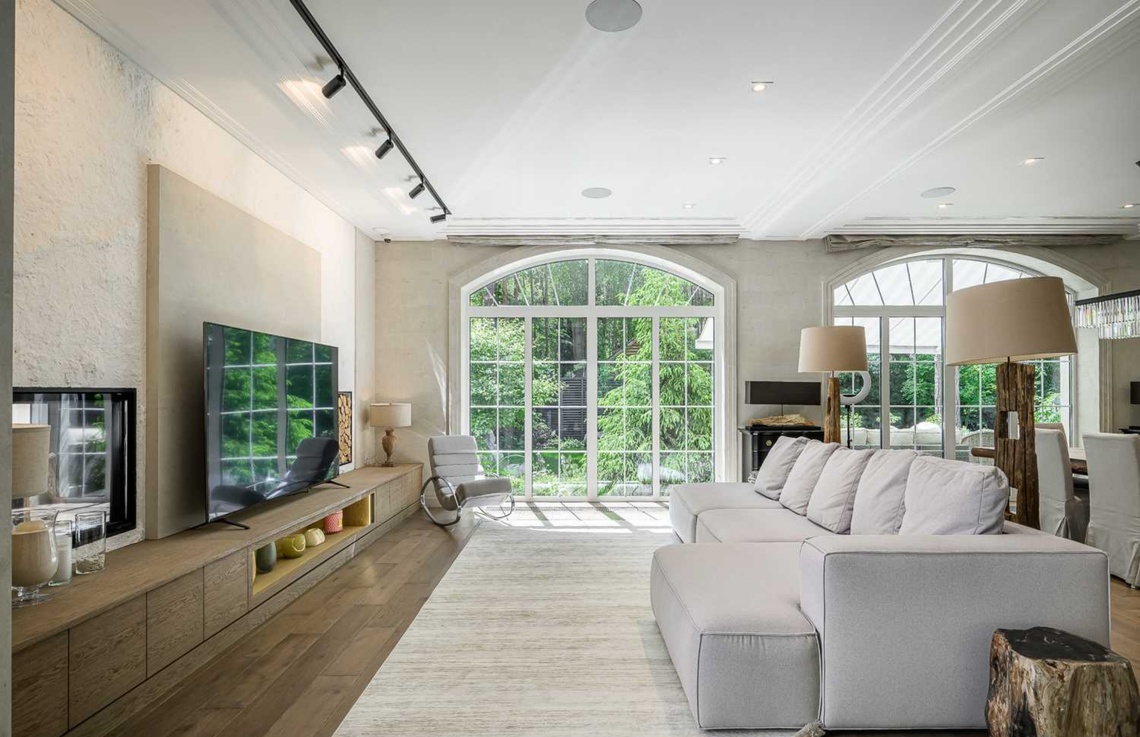
Рублёво-Успенское шоссе, 15 км., посёлок Пекин