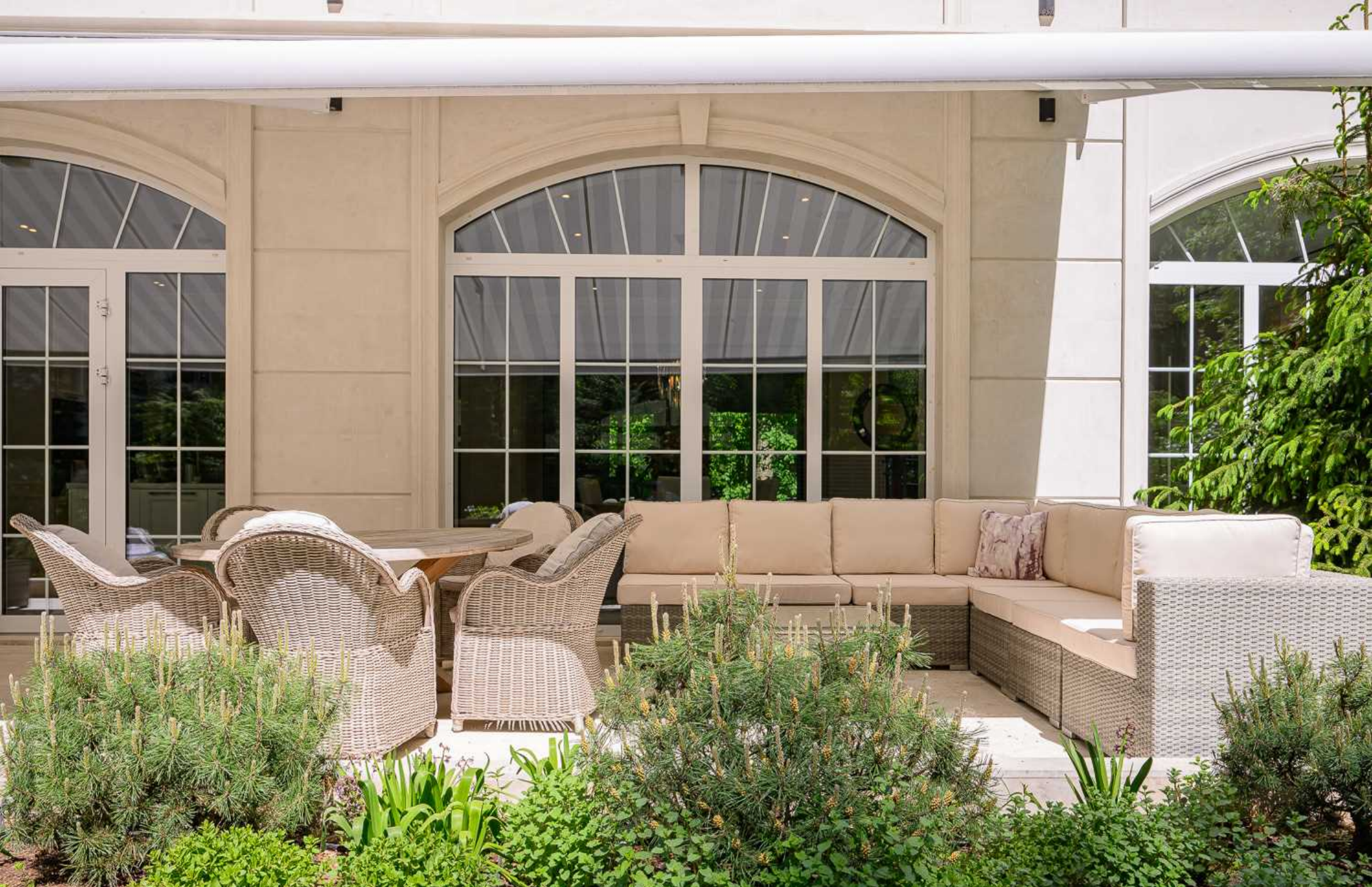
Рублёво-Успенское шоссе, 15 км., посёлок Пекин