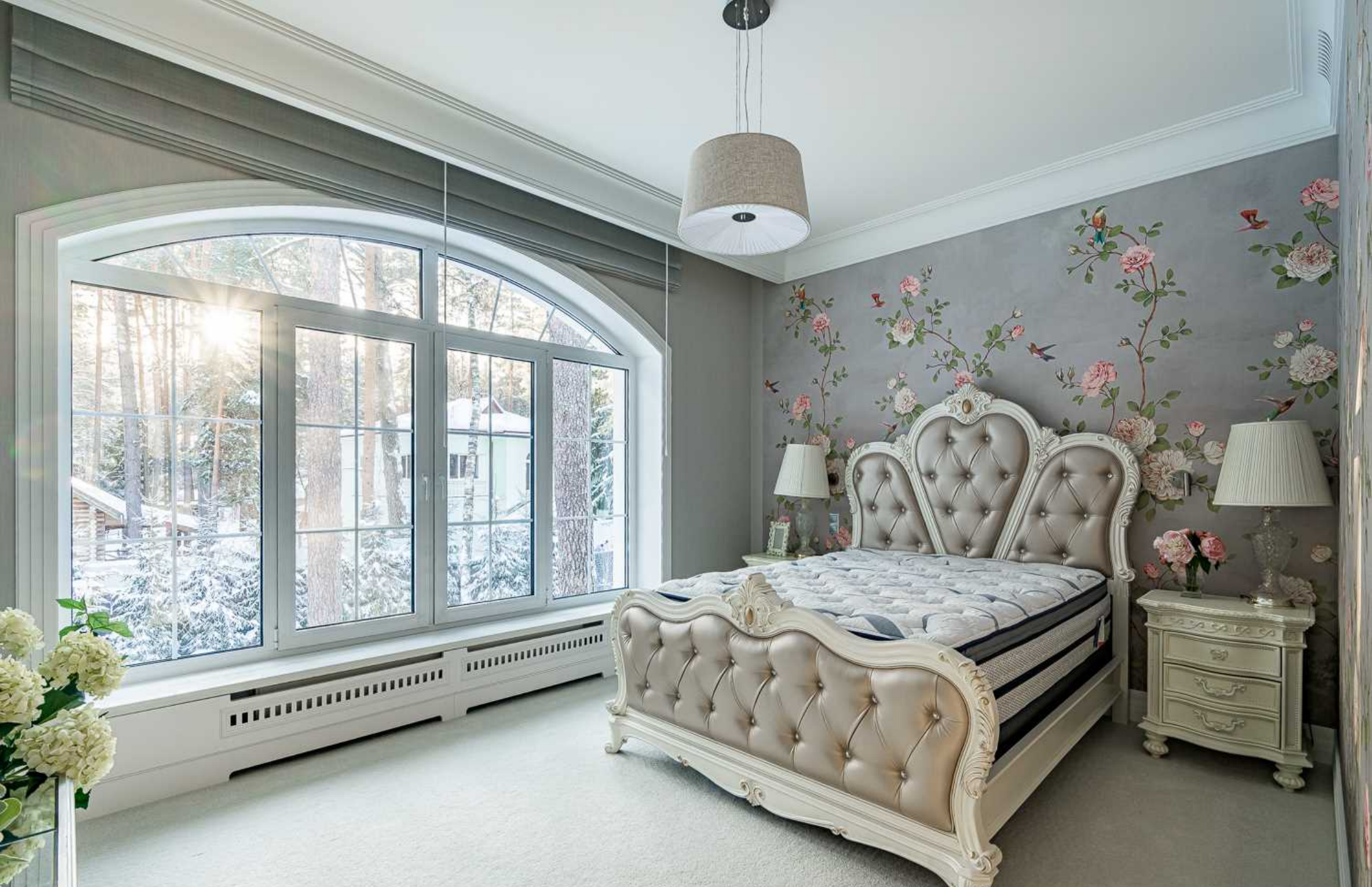
Рублёво-Успенское шоссе, 15 км., посёлок Пекин