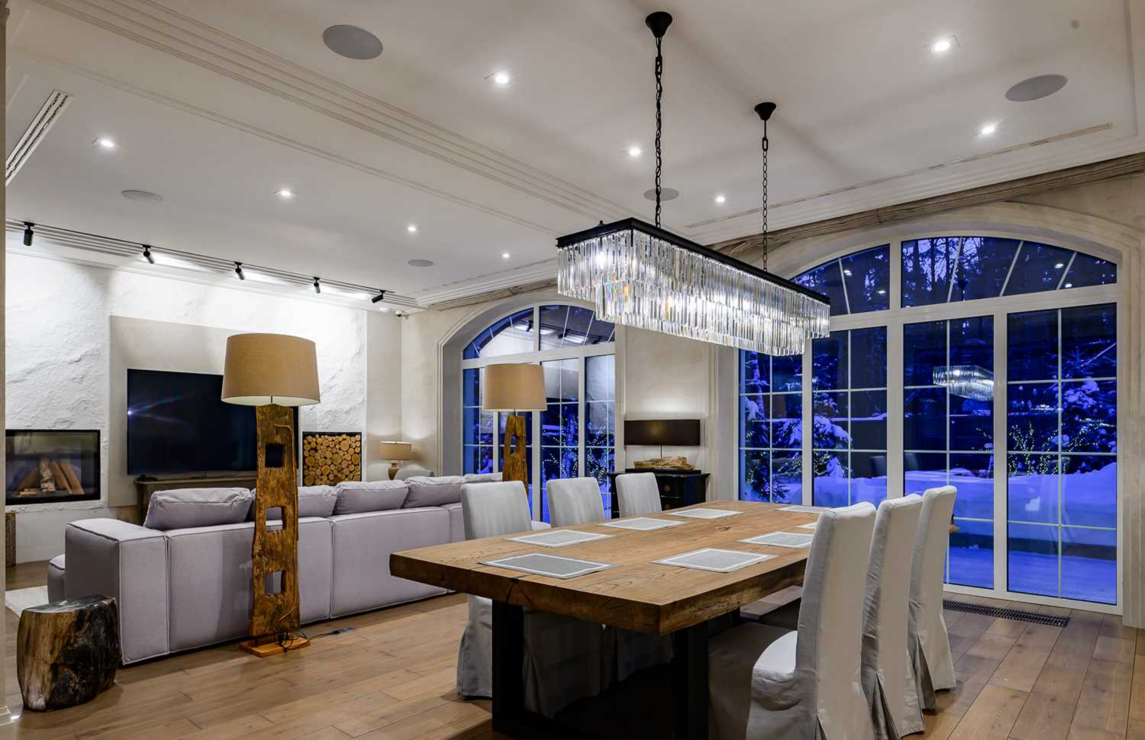
Рублёво-Успенское шоссе, 15 км., посёлок Пекин