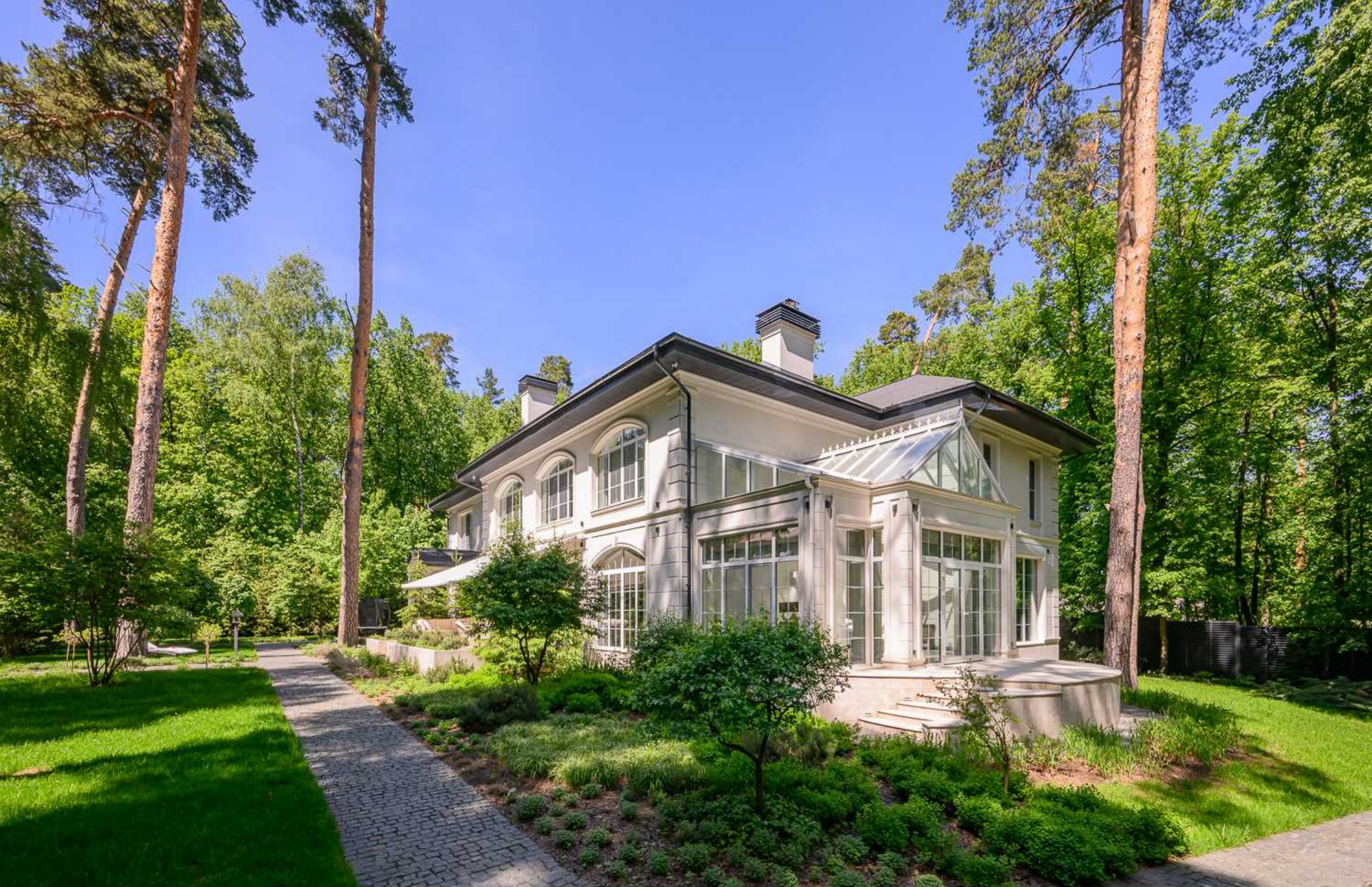
Рублёво-Успенское шоссе, 15 км., посёлок Пекин