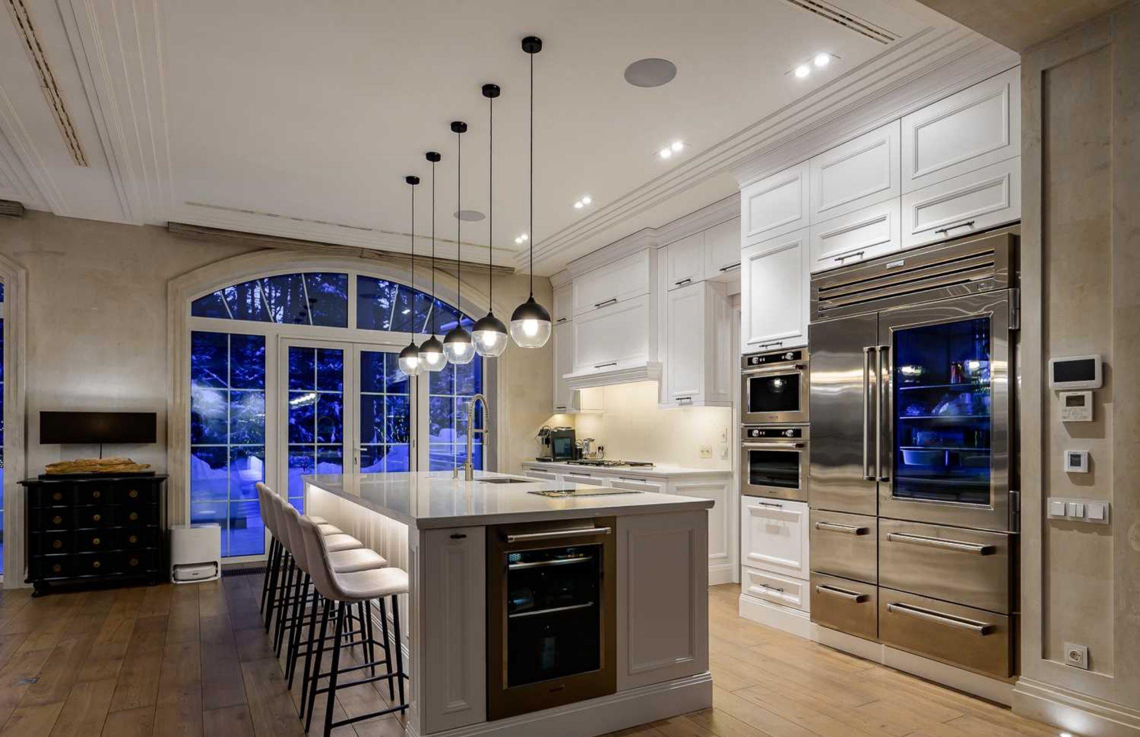
Рублёво-Успенское шоссе, 15 км., посёлок Пекин