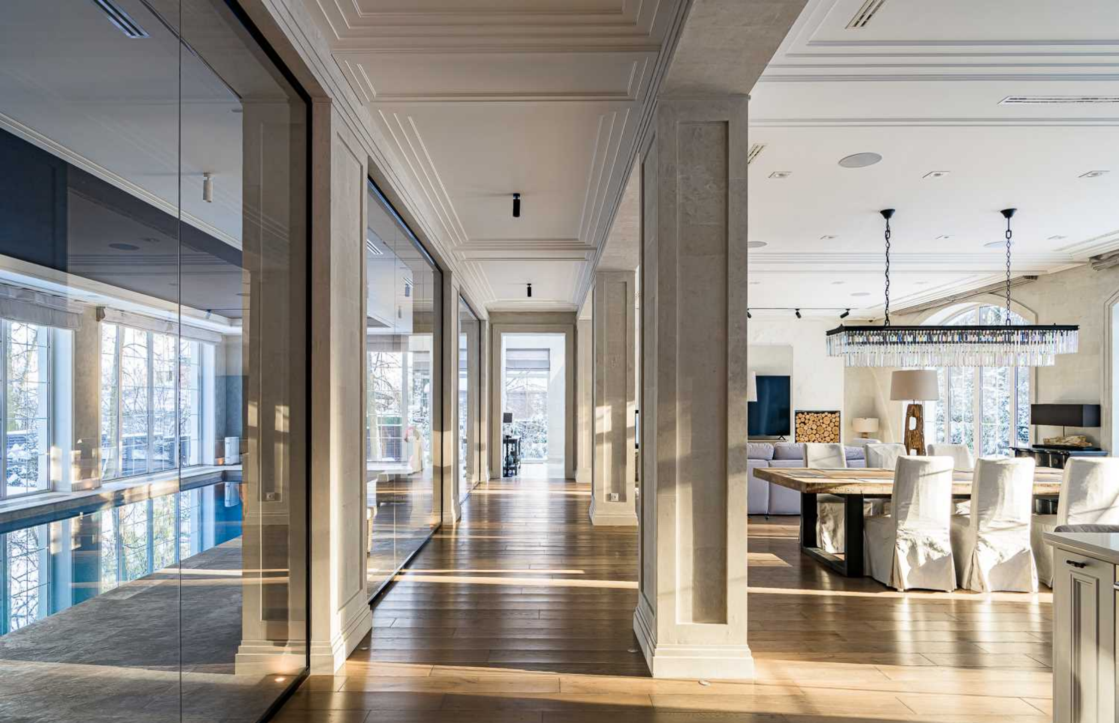
Рублёво-Успенское шоссе, 15 км., посёлок Пекин