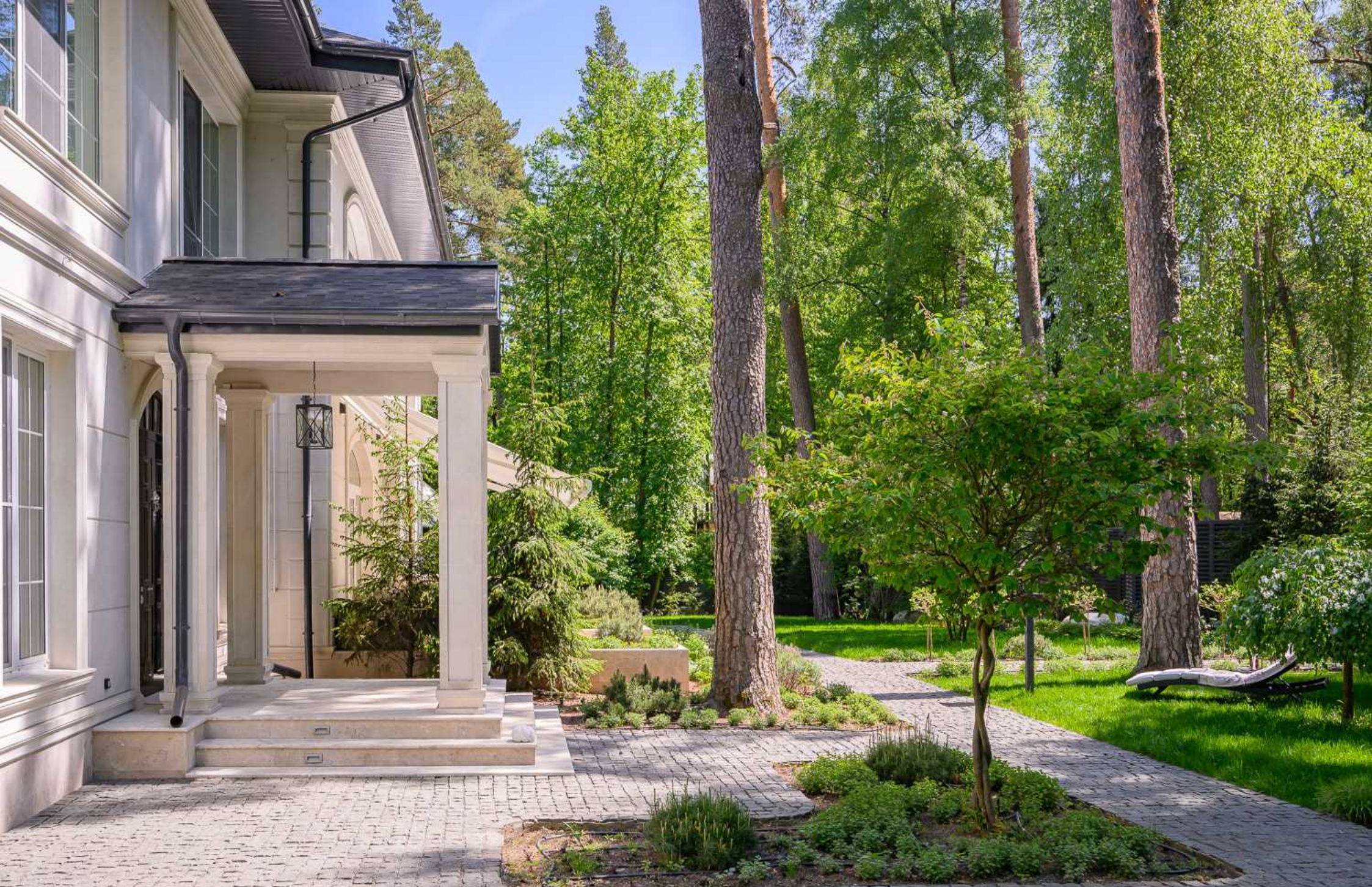
Рублёво-Успенское шоссе, 15 км., посёлок Пекин