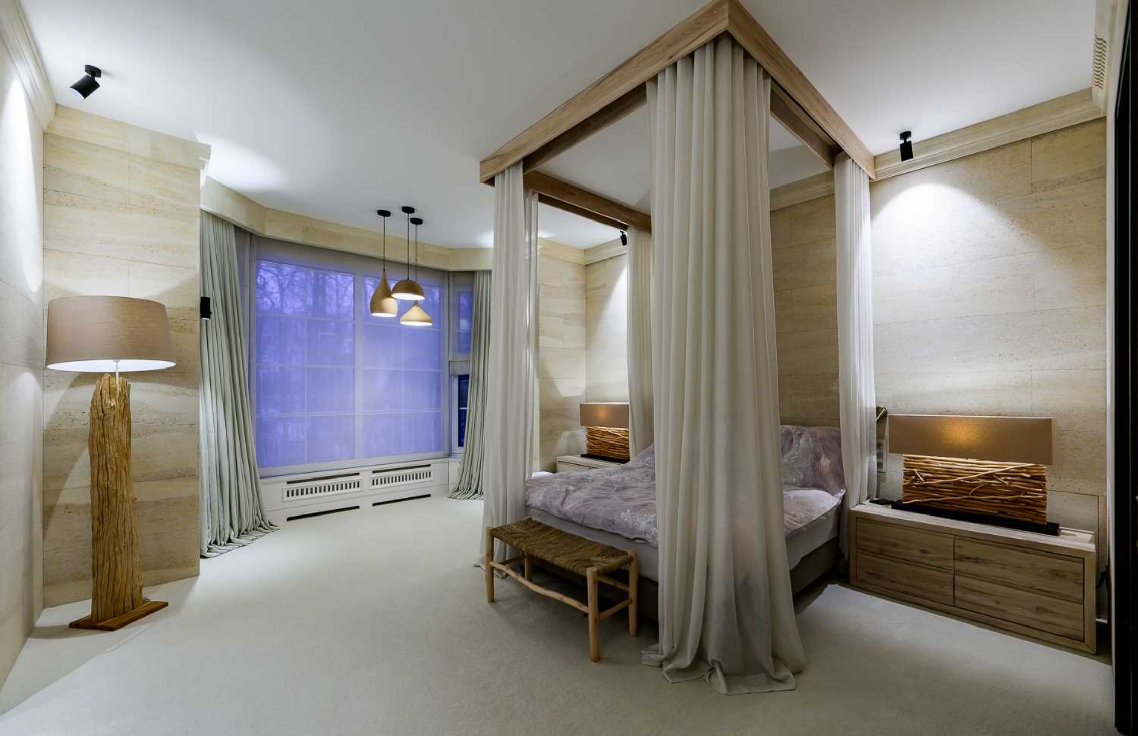
Рублёво-Успенское шоссе, 15 км., посёлок Пекин