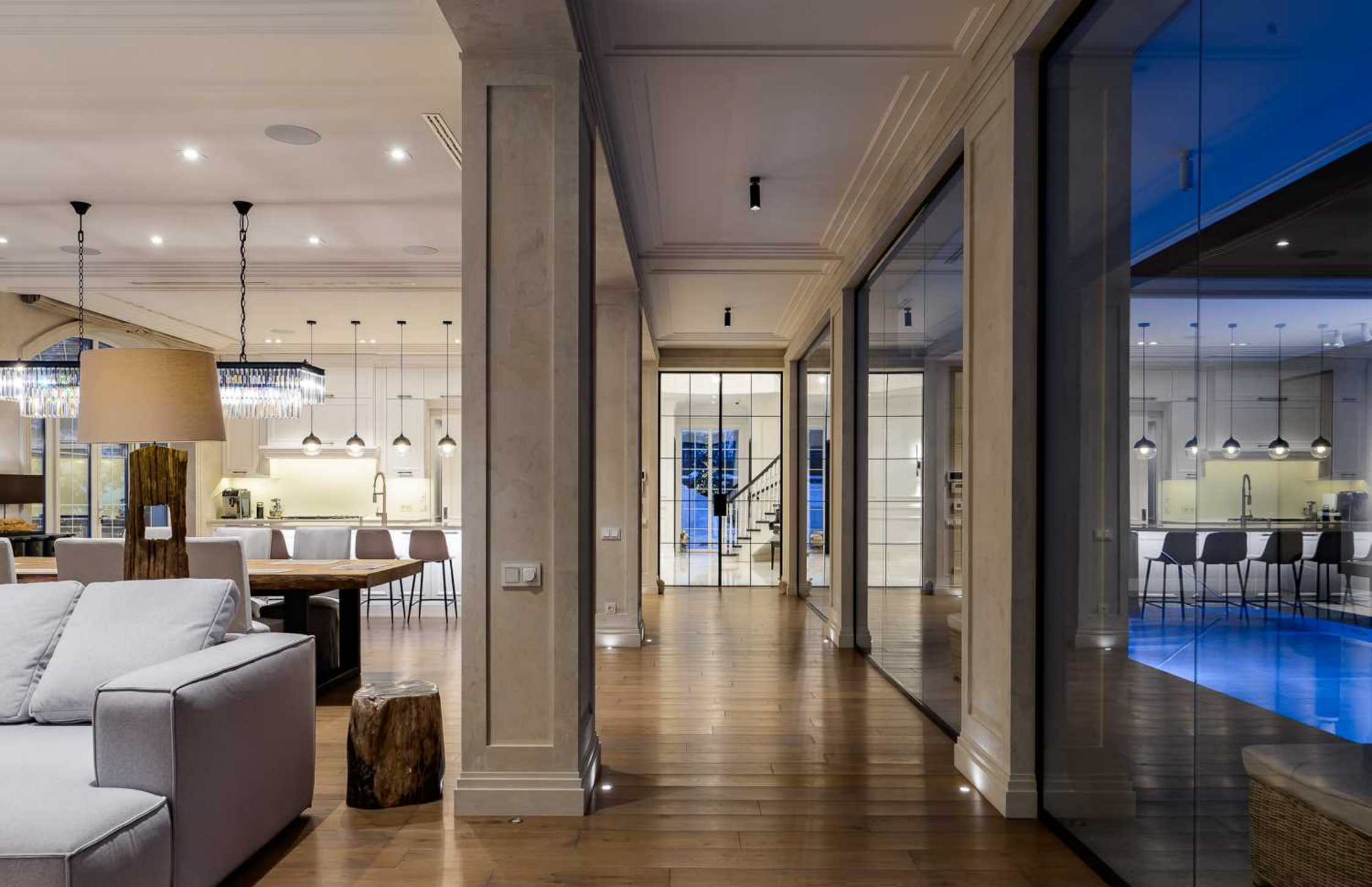
Рублёво-Успенское шоссе, 15 км., посёлок Пекин