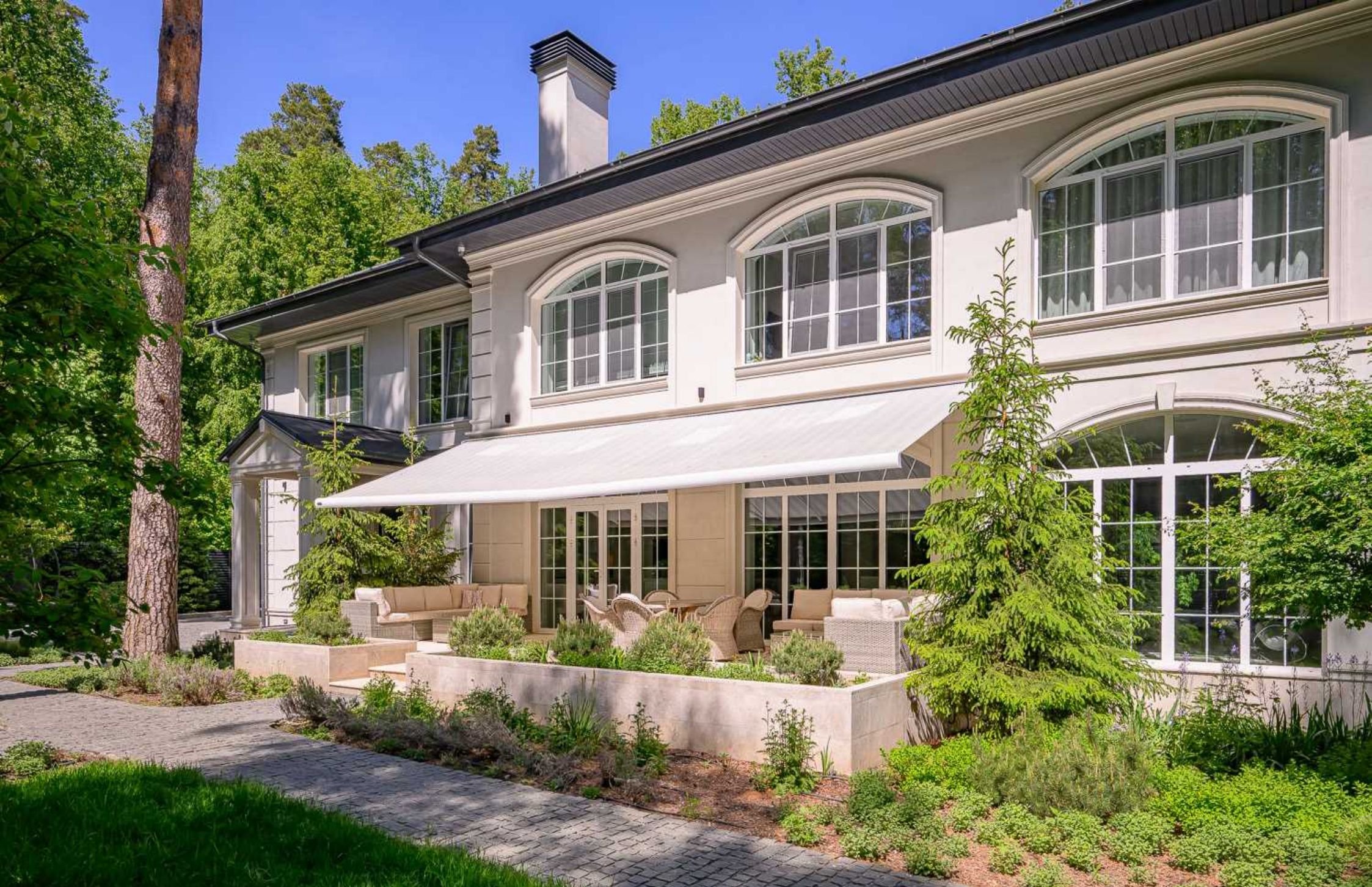
Рублёво-Успенское шоссе, 15 км., посёлок Пекин