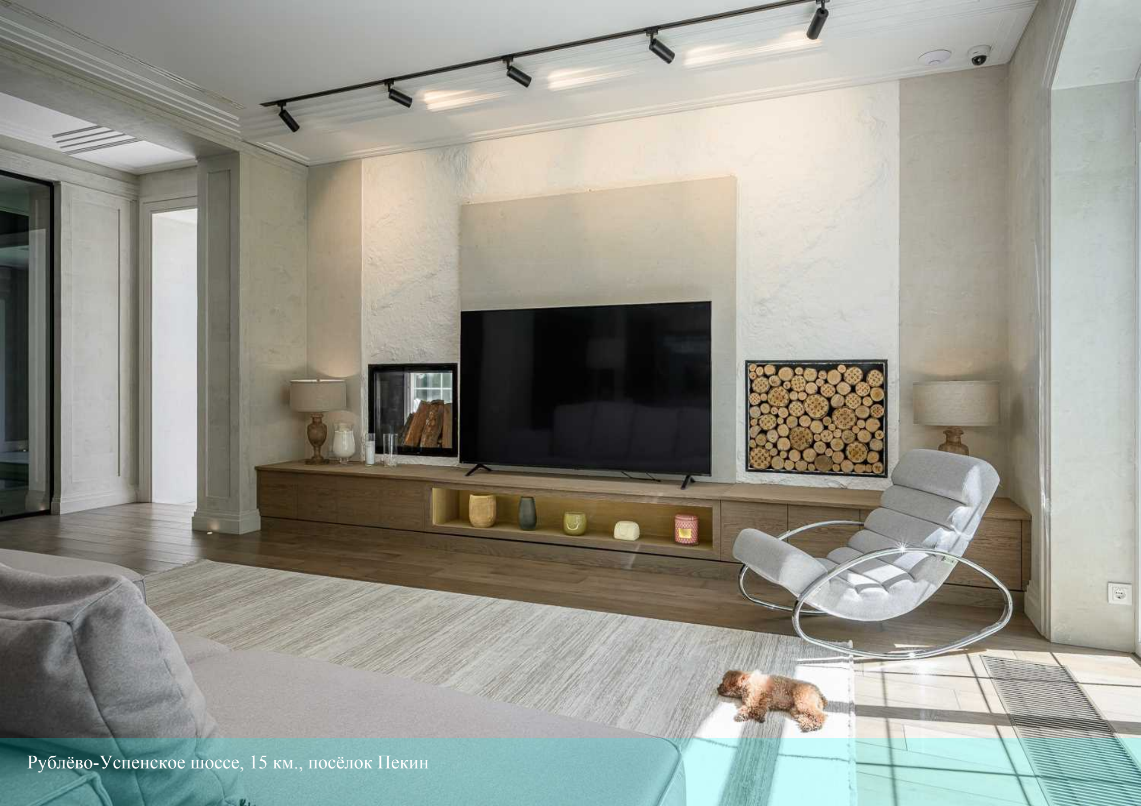
Рублёво-Успенское шоссе, 15 км., посёлок Пекин