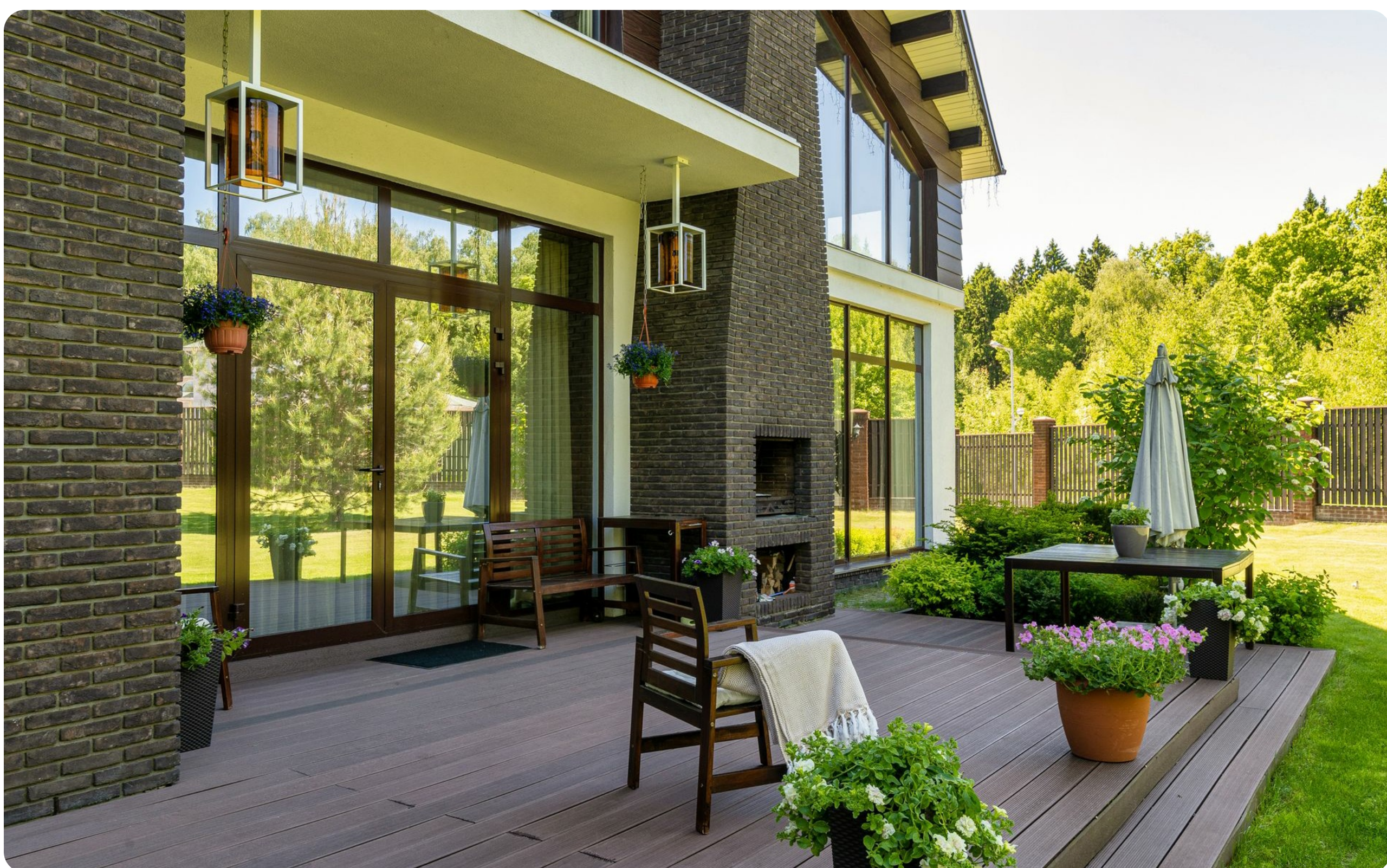
Коттеджный поселок "Аврора" 195 000 000 Р