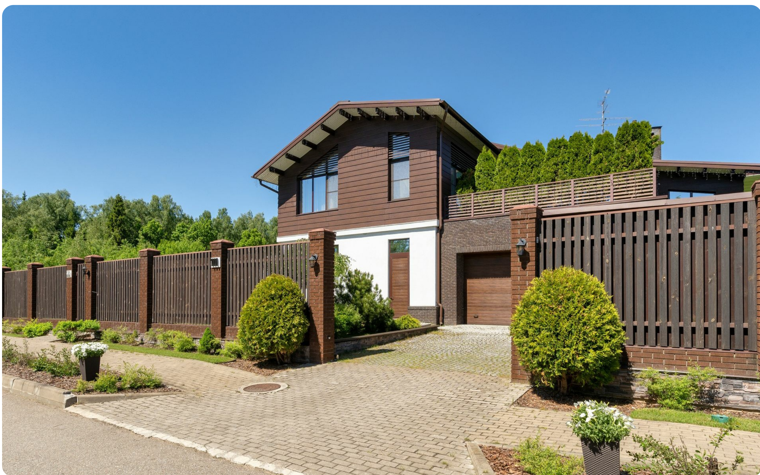
Коттеджный поселок "Аврора" 195 000 000 Р