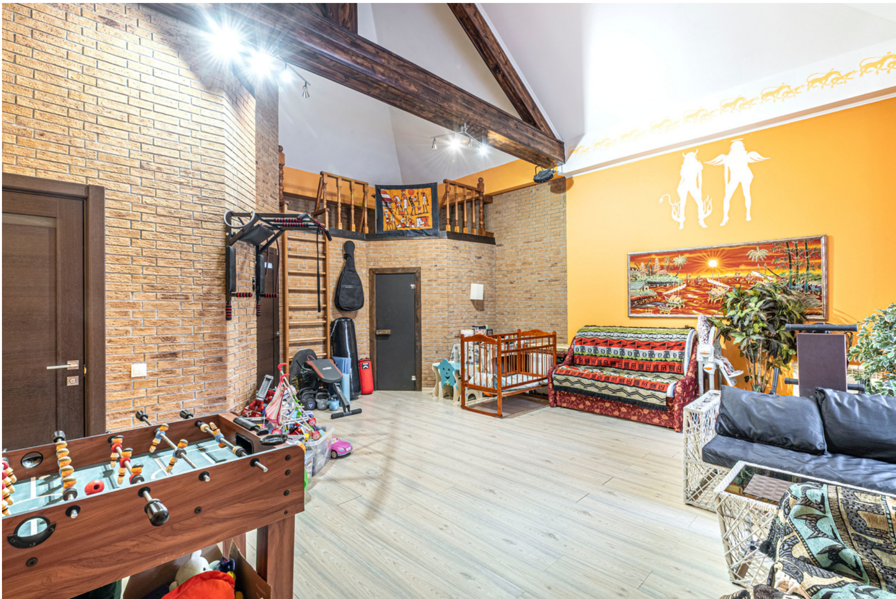
Лаундж-зона с сауной