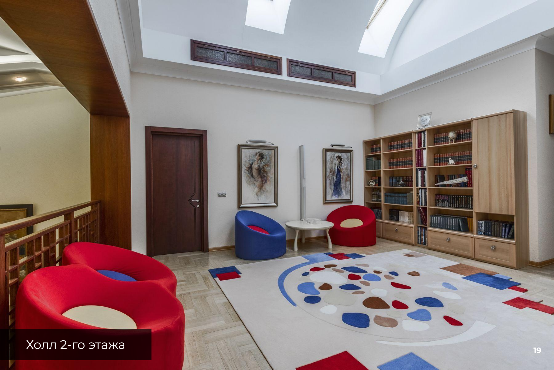
Холл 2-го этажа