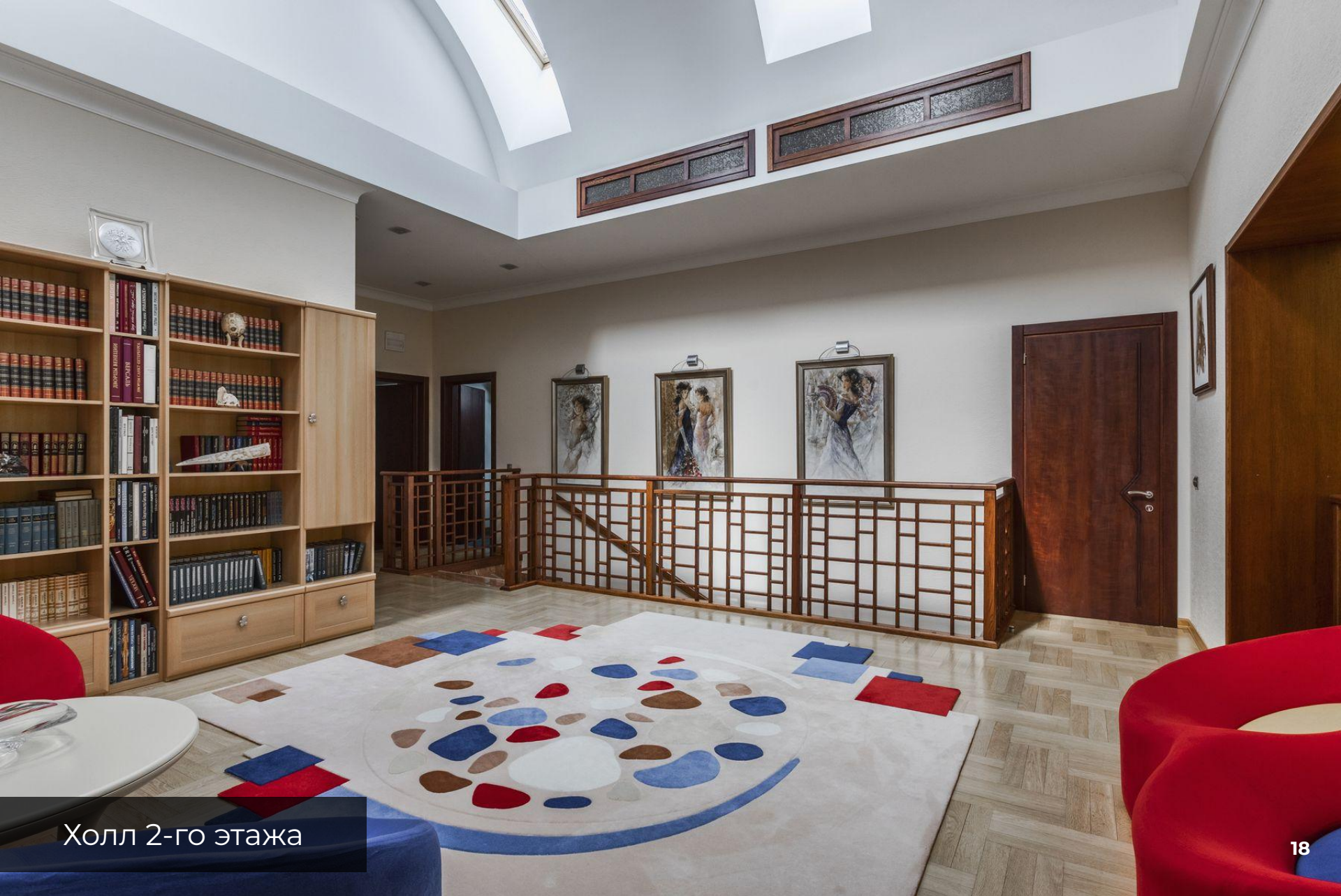
Холл 2-го этажа