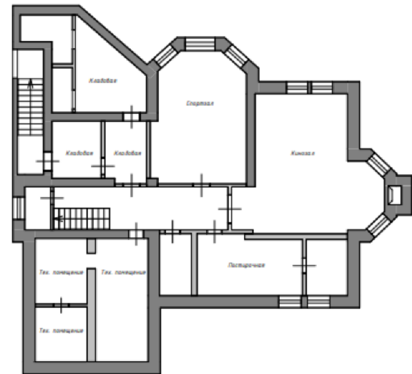
План Подвального этажа