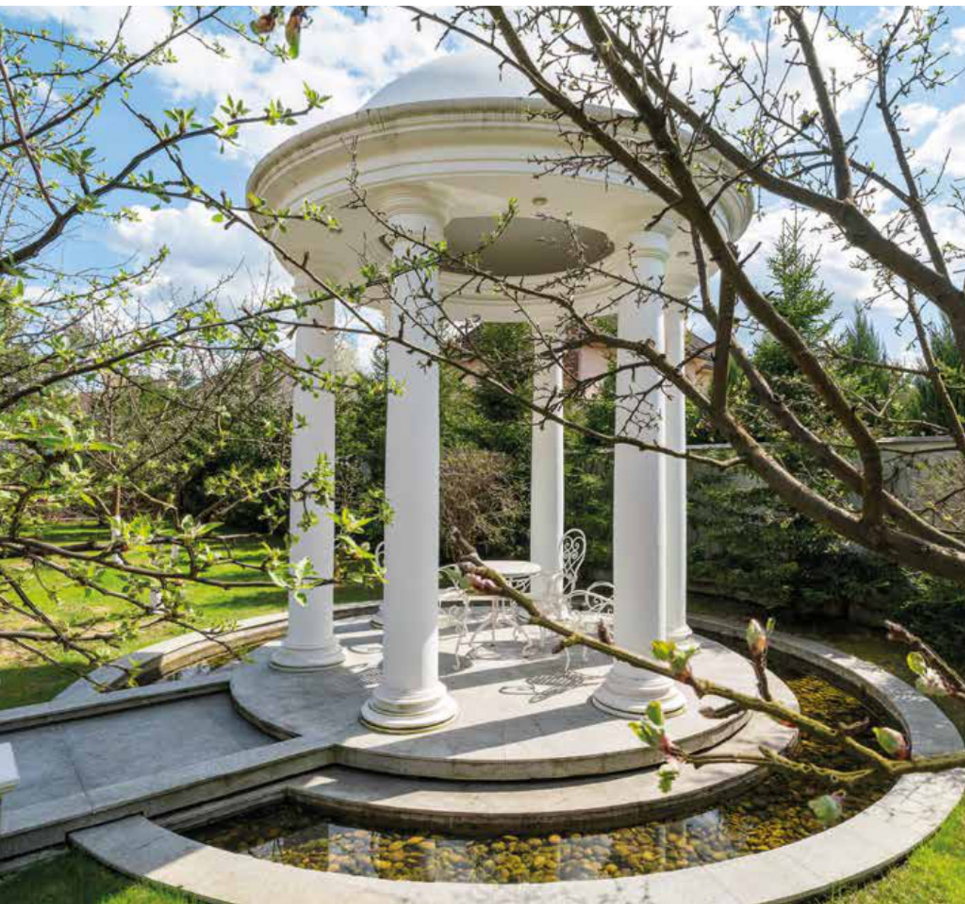
ЧАЙНАЯ БЕСЕДКА - РОТОНДА. ТЕПЛИЦА