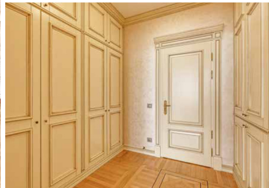
СПАЛЬНИ. 2-Й ЭТАЖ