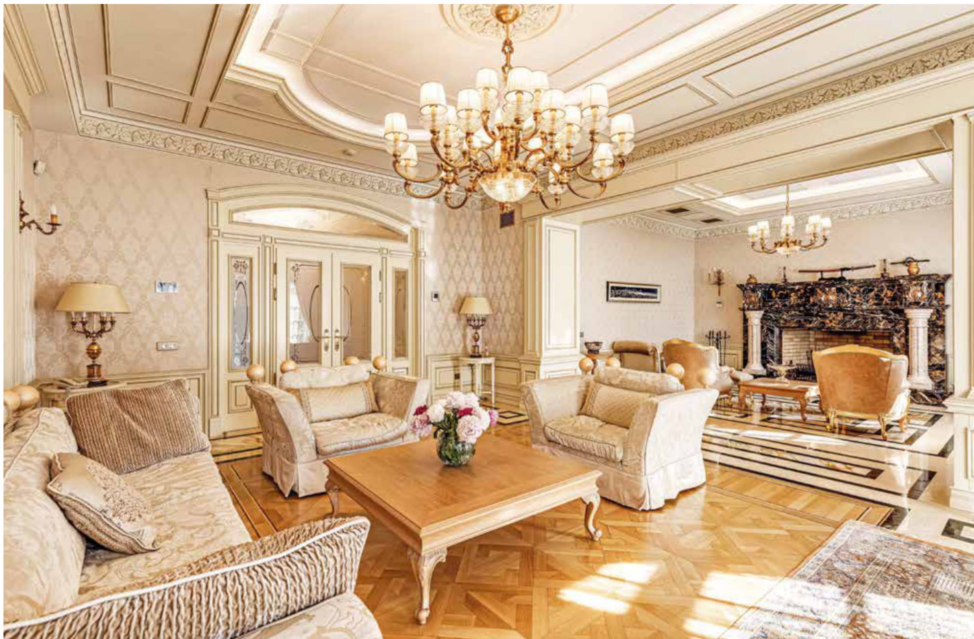
БОЛЬШАЯ ГОСТИНАЯ С КАМИНОМ