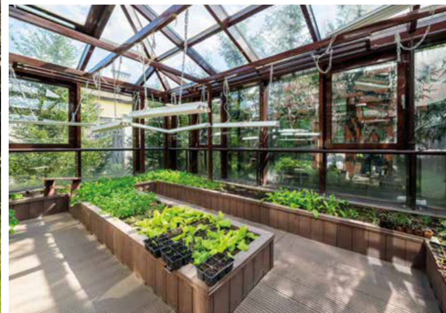
РЕЗИДЕНЦИЯ - СОЛНЕЧНАЯ ПОЛЯНА | 25