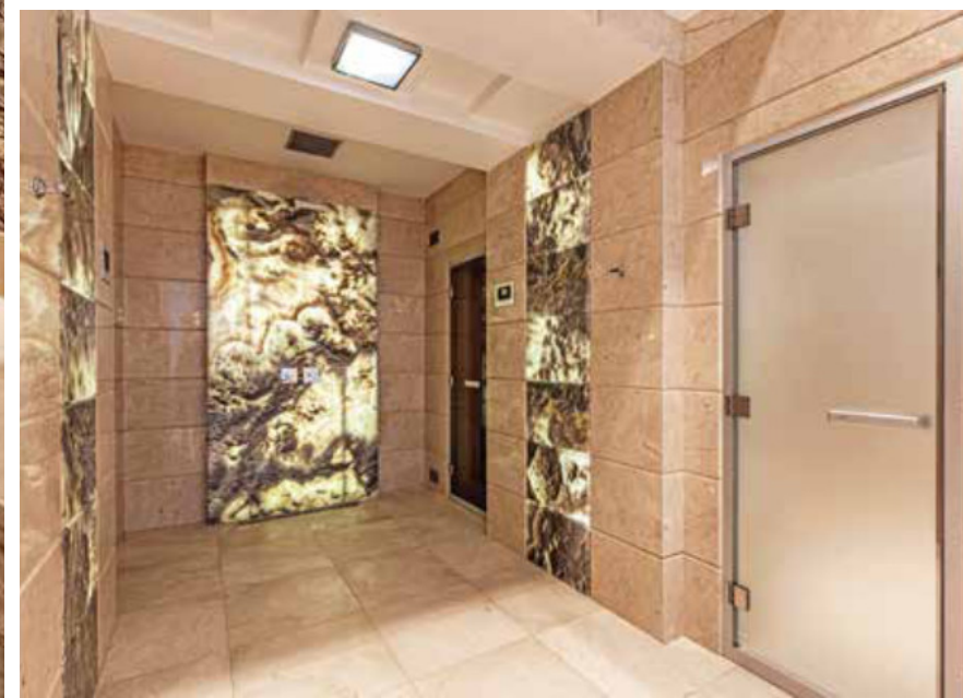
СПА-КОМПЛЕКС. САУНА. ХАМАМ