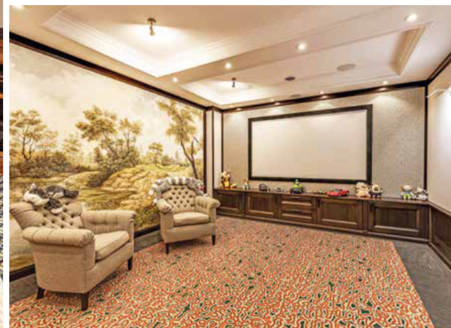
КИНОЗАЛ. ХОЛЛ ЦОКОЛЬНОГО ЭТАЖА. ДЕТСКАЯ ИГРОВАЯ