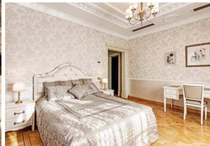
СПАЛЬНИ. 2-Й ЭТАЖ