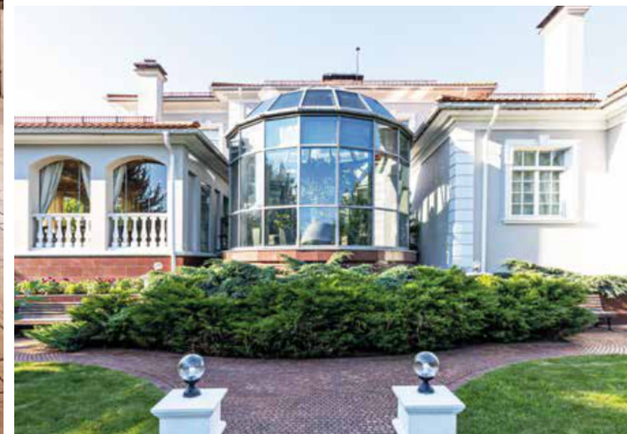
ВЕРАНДА С БАРБЕКЮ-ЗОНОЙ. ЗИМНИЙ САД