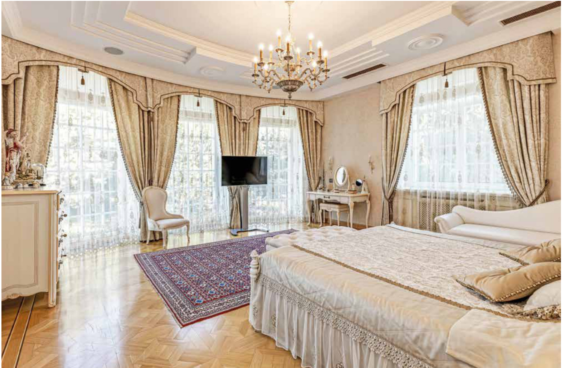
ПРИВАТНАЯ ЗОНА. ГЛАВНАЯ СПАЛЬНЯ