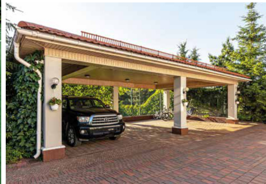
ТЕННИСНЫЙ КОРТ. ГОСТЕВОЙ ДОМ. НАВЕС ДЛЯ АВТО