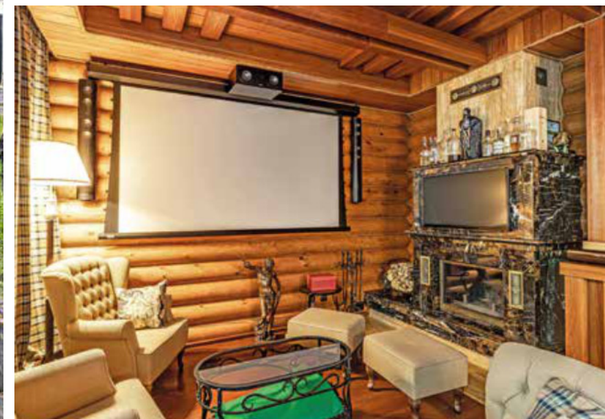
ОХОТНИЧИЙ ДОМ. ЛЕТНЯЯ БАРБЕКЮ-ЗОНА